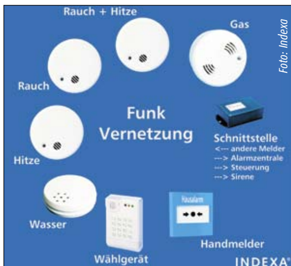
Indexa hat seinem Funksystem weitere Gefahrenmelder hinzugefügt. Die Funkrauchmelder des Systems sind nach VdS und DIN EN 14604 zertifiziert.