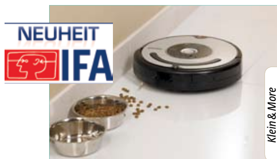
Klein & More